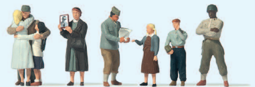
13404 75. Jahrestag »Ende des 2. Weltkrieges« □ 75th Anniversary »End of World War II«