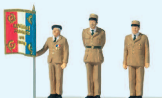
13406 80. Jahrestag »Charles de Gaulles Appell vom 18. Juni 1940« □ 80th Anniversary »Charles de Gaulles Appeal from London«